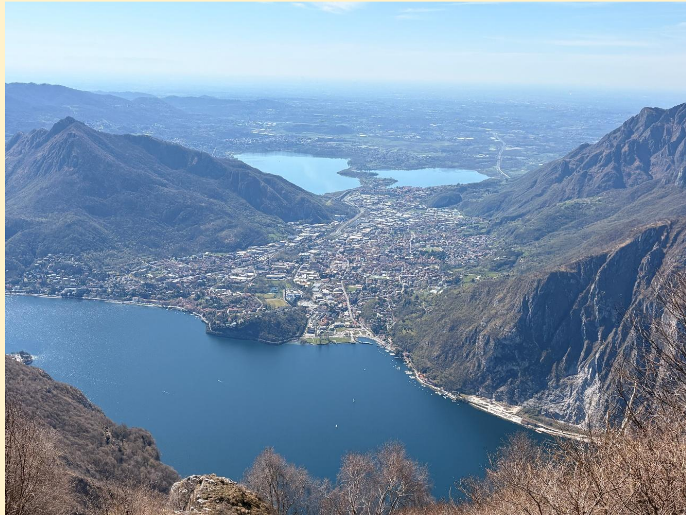
Blick auf Valmadrera von Osten

Zwischen Lago di Como, Monte Barro, Lago D'Annone und Monte Birone und Moregallo