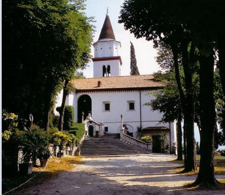
Santuario San Martino