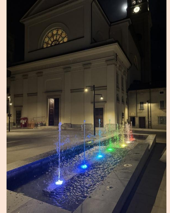
Brunnen auf der Piazza Mons. Citterio