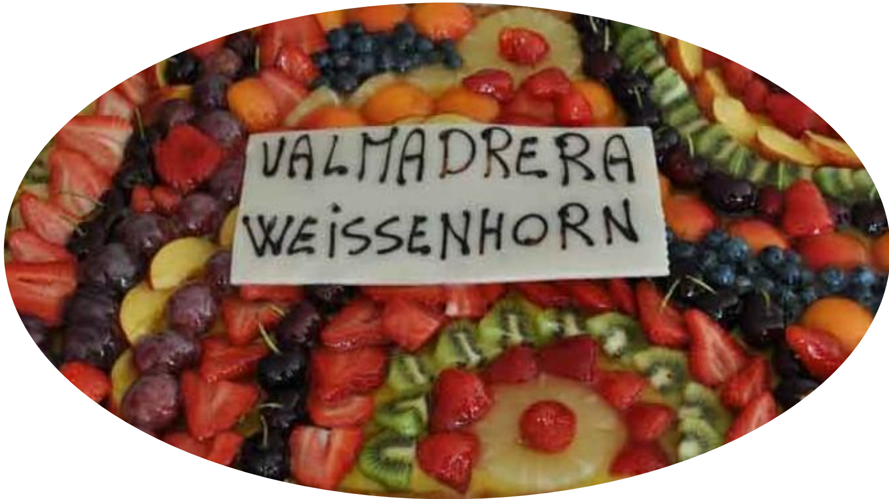
Wer, wie, was – Der Verein Freunde Valmadreras „Framici“ stellt sich vor