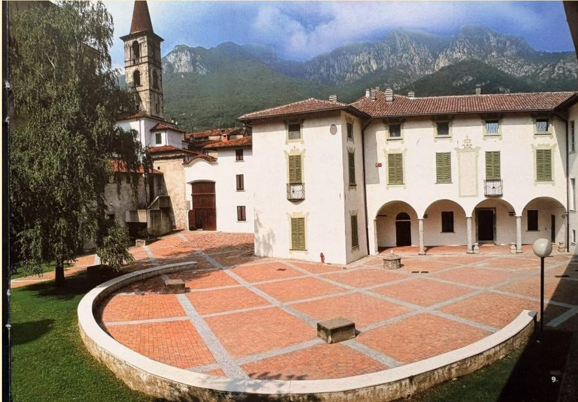
Centro Culturale Fatebenfratelli - Zentrum des kulturellen Lebens