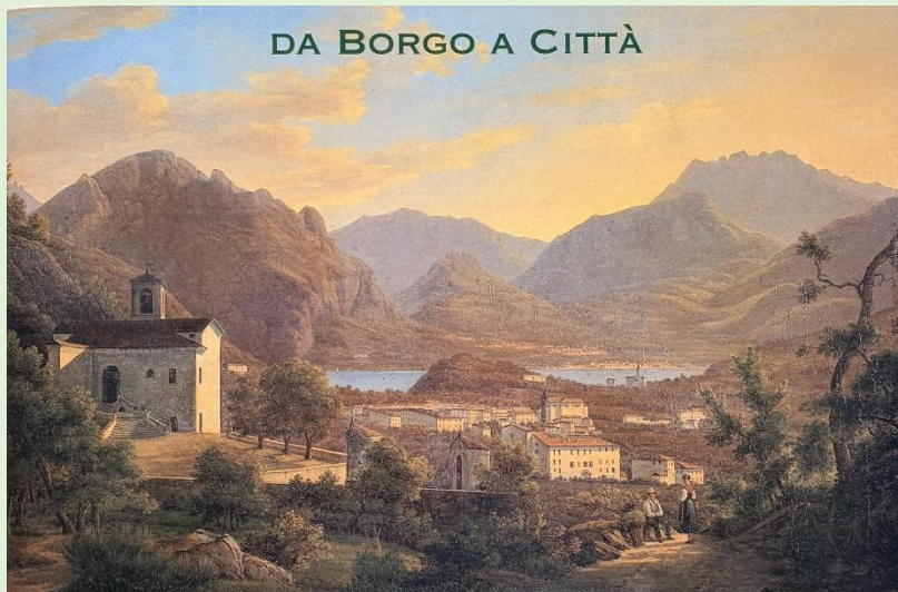
Blick von Westen, um 1850

Wer, wie, was – Der Verein Freunde Valmadreras „Framici“ stellt sich vor