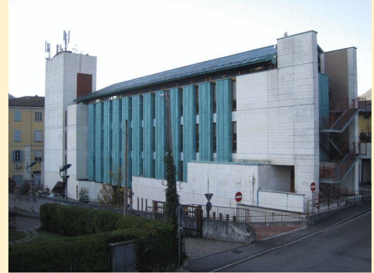
Das moderne Rathaus – eröffnet 2004