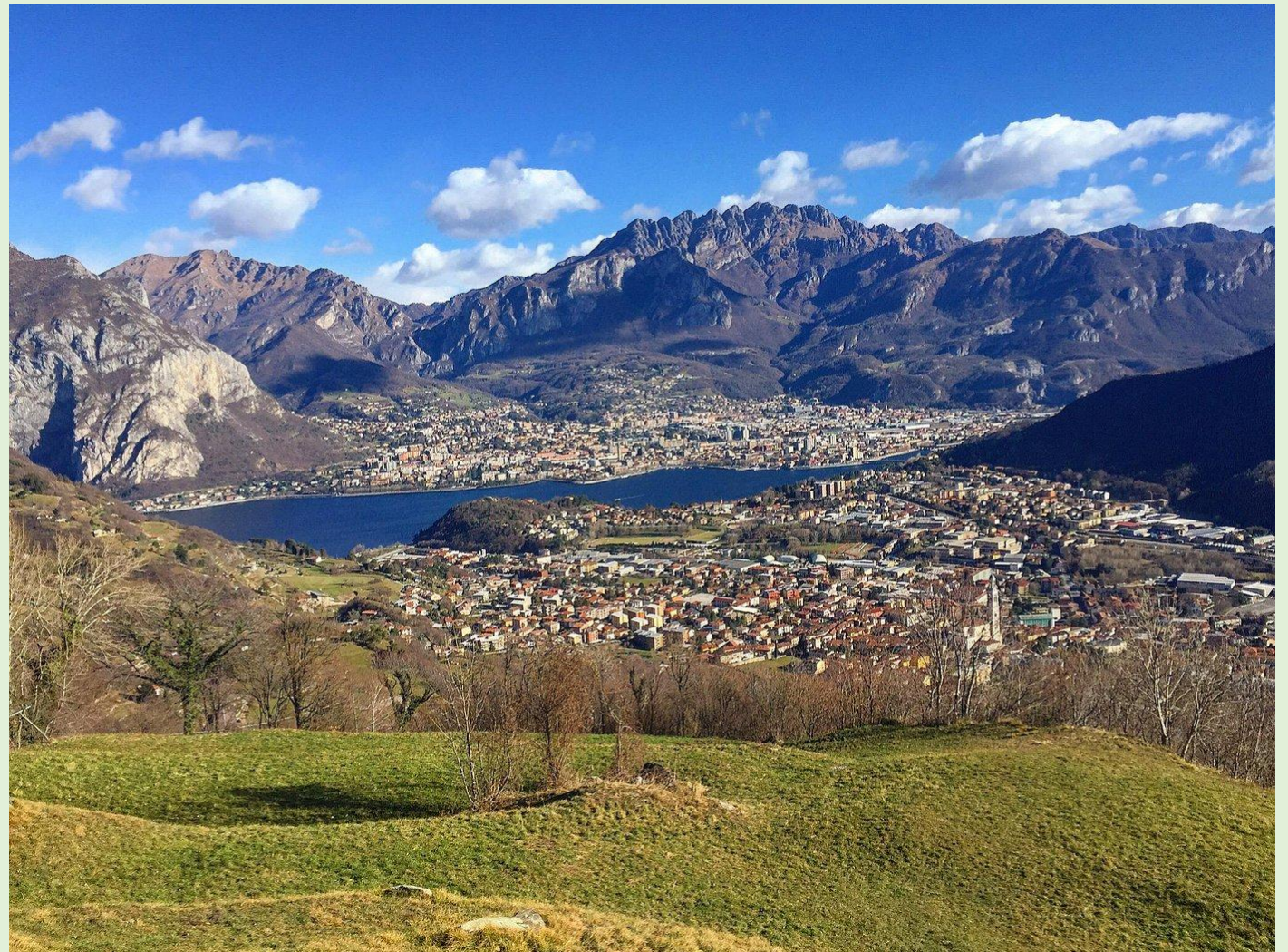
Blick von Westen, im Hintergrund Lecco, Hauptstadt der Provinz Lecco