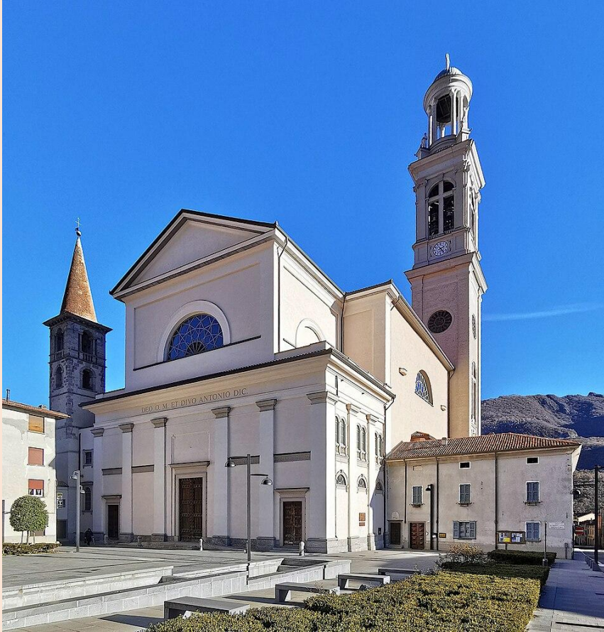
Pfarrkirche S. Antonio